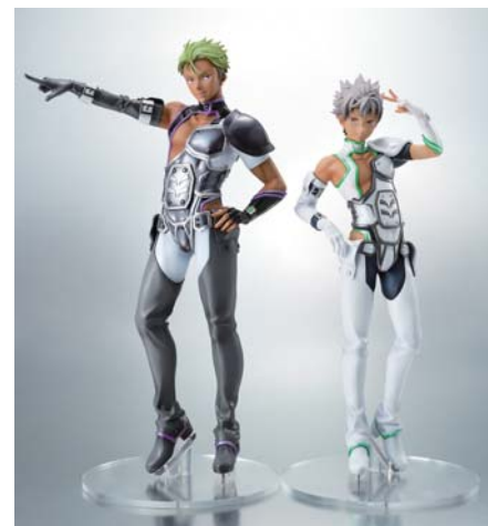
▲別売りの「大和アレクサンダー バトルスーツVer.」と並べて楽しむこともできます。